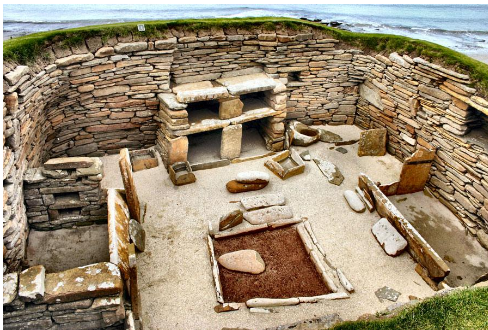
Рис. 3 Внутренний интерьер жилища-полуземлянки каменного века, раскопанного археологами на Оркнейских островах [21].

иберийского письма и тюркские руны (из того же жилища, что показано на рис. 3).