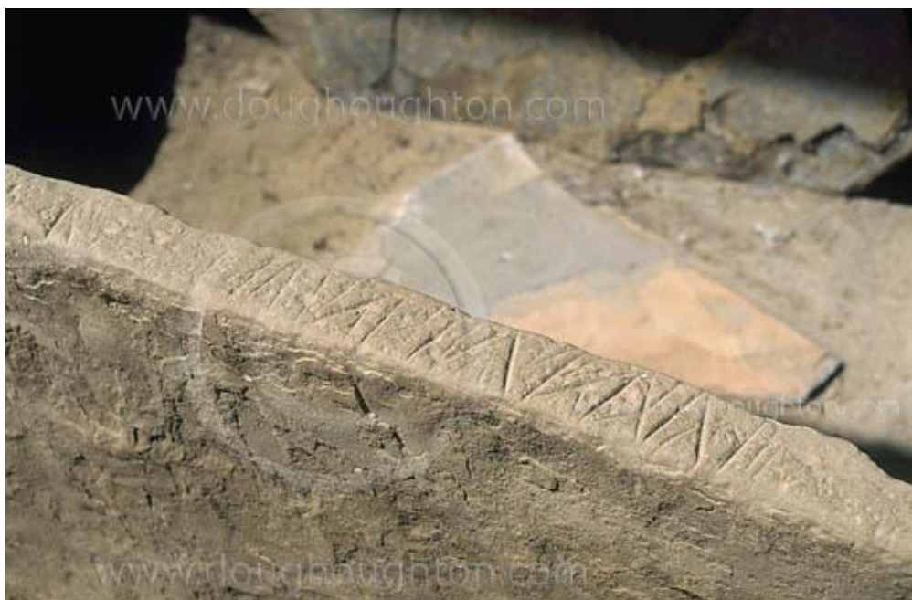
Рис. 4 Спинка каменной кровати, исписанная знаками письма, напоминающими знаки иберийского письма и тюркские руны.

Новая волна пришельцев стала сооружать повсеместно культовые центры в виде насыпных курганов, окруженных менгирами. Такая традиция происходит с юго-востока нынешней Турции от носителей Убейдской