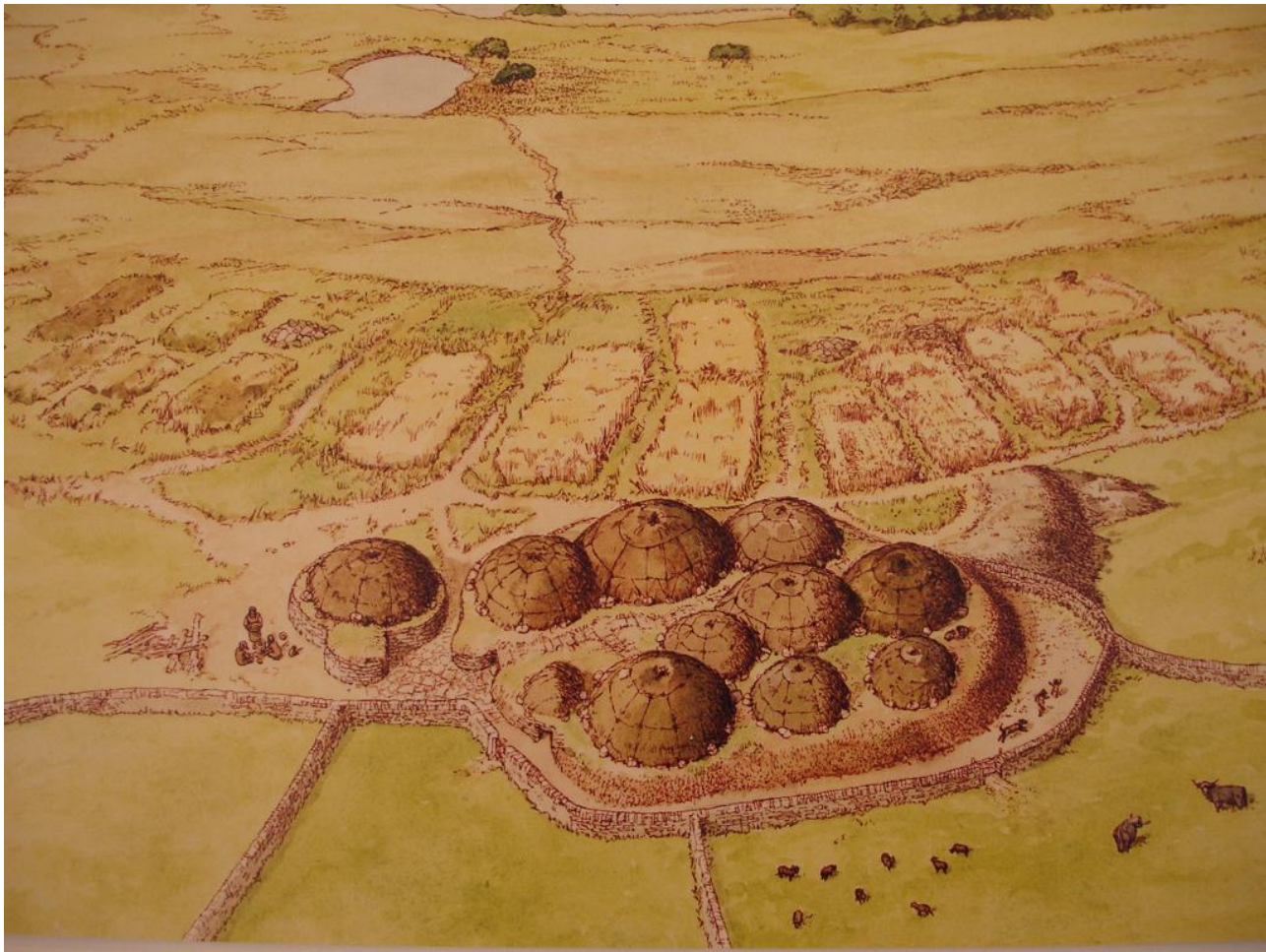
Рис.1 Планировка поселка priteni в местечке Скара-Брей на одном из Оркнейских островов [31].

Постепенно поселки priteni разрастались и превращались в своего рода «города» с относительно крупными центральными святилищами. В конце концов север Британии получил название Кале-дония , что в иберийских диалектах Испании [11,16] означает ‘Страна городов (с крепостной стеной)’.