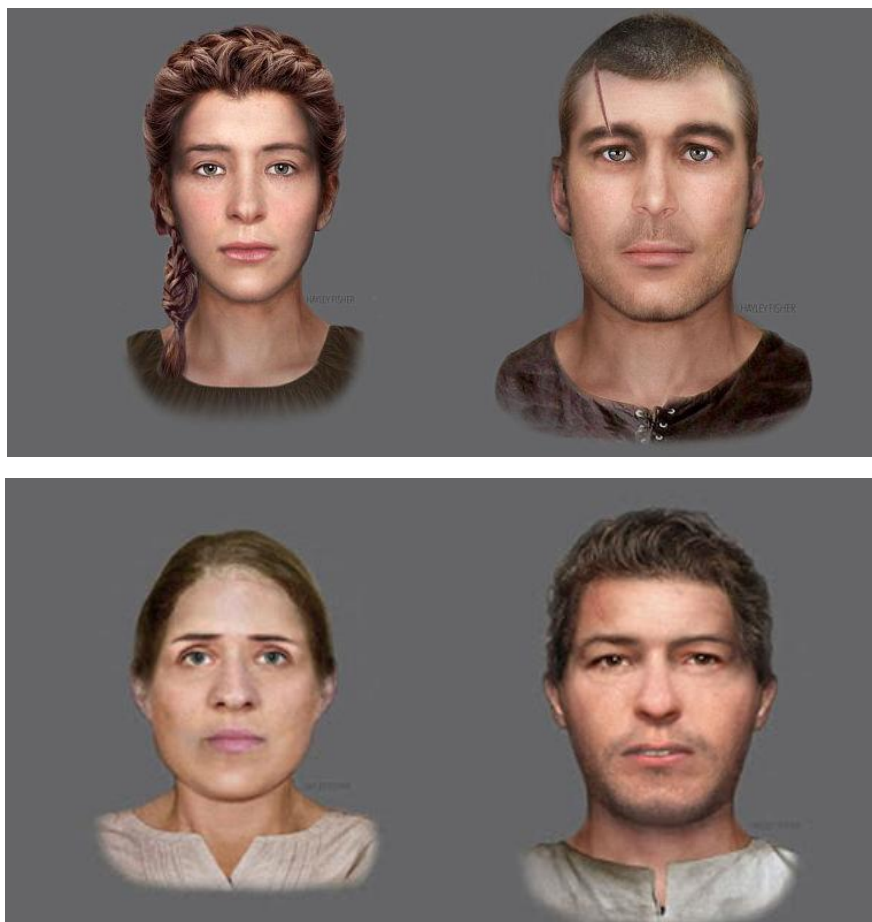
Рис. 6 Изображения лиц четырех пиктов, жителей Шотландии VI в. н. э., восстановленные по черепам сотрудниками Эдинбургского университета [20].

На рис. 6 мы приводим фотографии четырех жителей острова Крамонд (недалеко от Эдинбурга) VI в. н. э. Их изображения восстановили ученые Эдинбургского университета по черепам, найденным в семейном склепе одного из местных (пиктских) аристократов [20]. Как видим, по чертам лица эти двое мужчин и две женщины напоминают казанских татар (потомков волжских булгар), а также жителей Северного Кавказа.